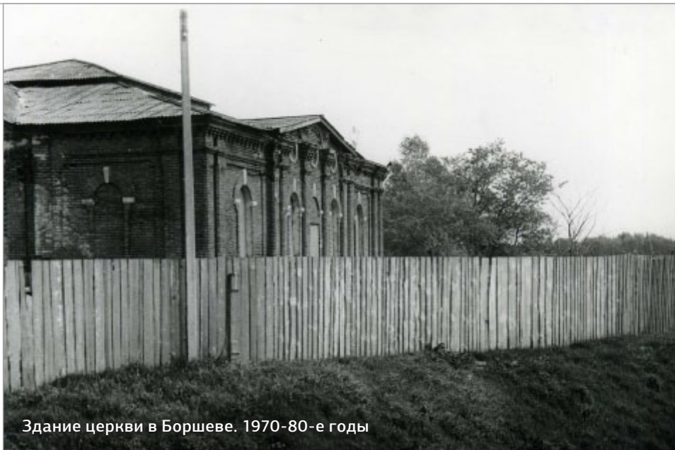
Здание церкви в Боршеве. 1970-80-е годы

Боршева возникла примерно во II веке нашей эры на территории укрепленного поселения местных племен, дожившего до времени создания славянского городка. Прежнее поселение было небольшим – 70х50 метров. Как Москва, Коломна и Дмитров, оно первоначально имело оборонительное значение, чему способствовало то обстоятельство, что выстроено оно было на малодоступном высоком мысу над поймой реки Москвы между двумя сходящимися оврагами. Это древнее поселение, которое неоднократно обследовали археологи, было ровесником знаменитого Херсонеса. В 1973-1978 годах на площади 800м 2 ученые нашли остатки жилых помещений, производственных построек, древних горнов – очагов с остатками прокаленного песка с вкраплениями болотных руд, добывавшихся в окрестностях. Также были выявлены глинобитные сооружения, связанные с древнейшей